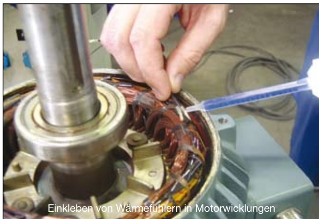
Einkleben von Wärmefühlern in Motorwicklungen