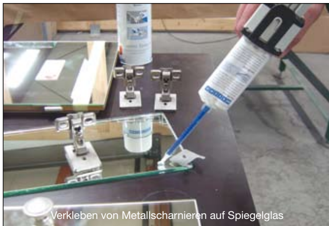
Verkleben von Metallscharnieren auf Spiegelglas

werden heute immer höhere Anforderungen (z.B. optisch ansprechende Verbindungen bei sehr hohen Festigkeiten) gestellt. Häufig werden diese Werkstoffe auch miteinander kombiniert, was zu zusätzlichen Anforderungen führt.