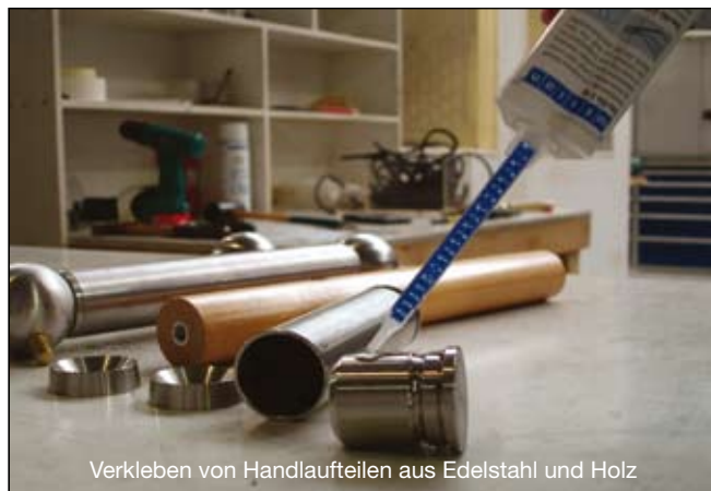
Verkleben von Handlaufteilen aus Edelstahl und Holz