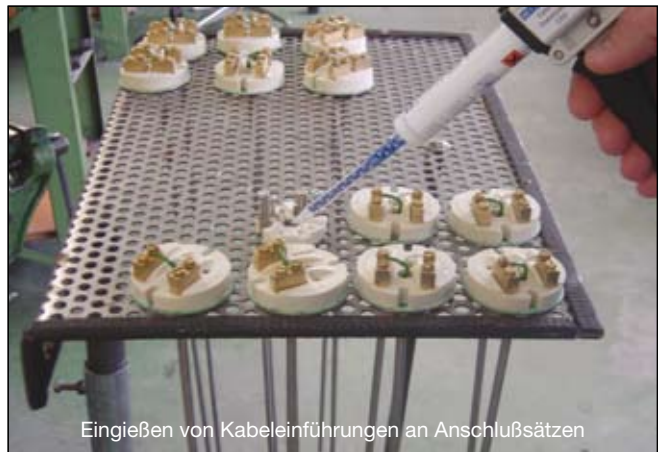
Eingießen von Kabeleinführungen an Anschlußsätzen

Durch die Verwendung von WEICON Epoxyd-Klebstoffen ergeben sich daher in allen Bereichen vielfältige Anwendungsmöglichkeiten. Sie reichen von einfachen Reparatur- und Ausbesserungsarbeiten bis hin zu Serienanwendungen in fast allen Industriebereichen.