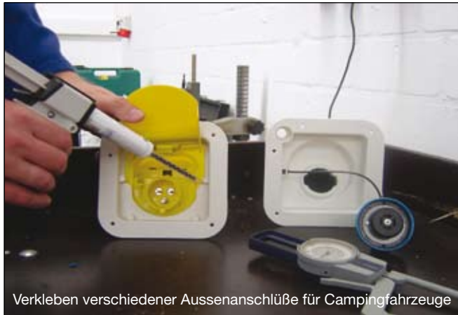
Verkleben verschiedener Aussenanschlüsse für Campingfahrzeuge

Alle in diesem Prospekt enthaltenen Angaben und Empfehlungen stellen keine zugeicherten Eigenschaften dar. Sie beruhen auf unseren Forschungsergebnissen und Erfahrungen. Sie sind jedoch unverbindlich, da wir für die Einhaltung der Verarbeitungsbedingungen nicht verantwortlich sein können, da uns die speziellen Anwendungsverhältnisse beim Verwenden nicht bekannt sind. Eine Gewährleistung kann nur für ein stets gleichbleibende hohe Qualität unserer Erzeugnisse übernommen werden. Wir empfehlen, durch ausreichende Eignungsuntersuchungen festzustellen, ob von dem angegebenen Produkt die von Ihnen gewünschten Eigenschaften erbracht werden. Ein Anspruch daraus ist ausgeschlossen. Für falschen oder zweckfremden Einsatz trägt der Verarbeiter die alleinige Verantwortung.