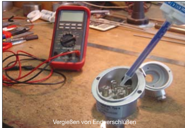
Vergießen von Endverschleiß