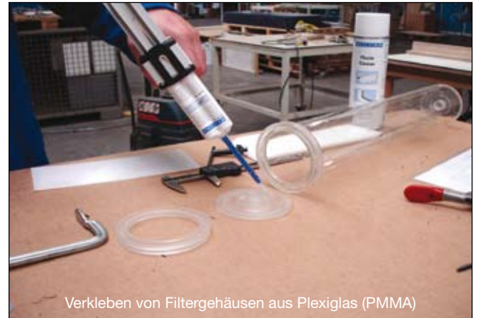
Verkleben von Filtergehäusen aus Plexiglas (PMMA)

Bei den WEICON Epoxyd-Klebstoffen gewährleistet die sorgfältige Auswahl und Kombination der Basis-Harze (Bisphenol A und F) eine Reduzierung der Kristallisation.